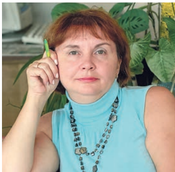
ФОТО ИЗ ЛИЧНОГО АРХИВА